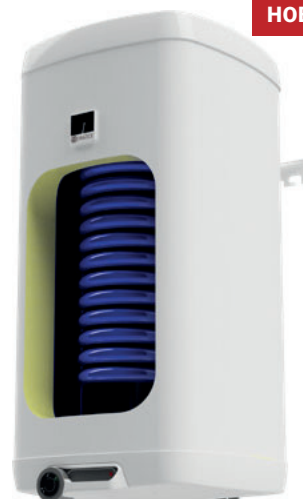
OKHE 125-160 NTR/DV